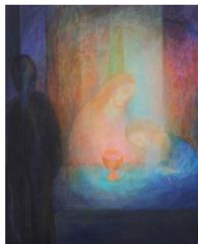
La Sainte Cène – Ninetta Sombart